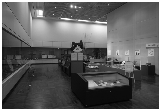
図1:誰もいない特別展会場(4月10日撮影)。

分布を調べるうえで、探したけどいなかった、という情報も有用です。この調査では約500メートル四方の範囲を30分間探索してスクミリンゴガイの卵塊(または貝)を見つけれなかった場合は、調査した範囲の中心付近の位置情報と日付を報告してもらい、「探してもいなかった」地点として扱うこと