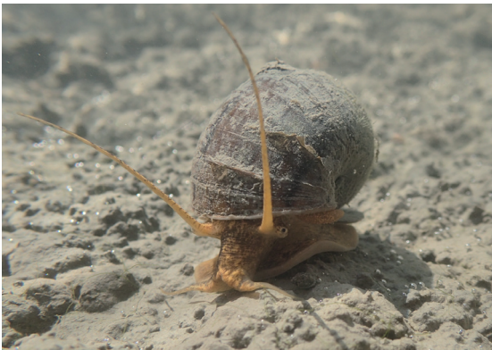
図2：水田の底を匍匐するスクミリンゴガイ。本文は3ページ。