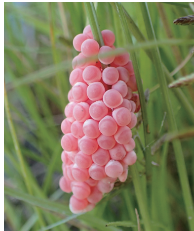
図3：スクミリンゴガイの卵塊。本文は3ページ。