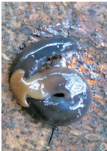
図1：ワタリコウガイビル（大阪城公園）。 本文15ページ。 図2：オオミスジコウガイビル。右上は頭部の拡大（京都府城陽市）。 本文15ページ。 図3：クロイコウガイビルまたはその近似種（枚岡公園）。本文15ページ。

Nature Study (ネイチャー・スタディ) Vol.60, No.2 (通巻117号) 2014年2月10日発行・1089年(昭和34年)3月14日 第3種郵便物認可 発行所 大阪市立自然史博物館友の会(振替00830-4-8976) 発行人 西山謙朗 〒546-0034 大阪市東淀川区長居公園1-23 大阪市立自然史博物館内 電話(06)9897-6221(代)