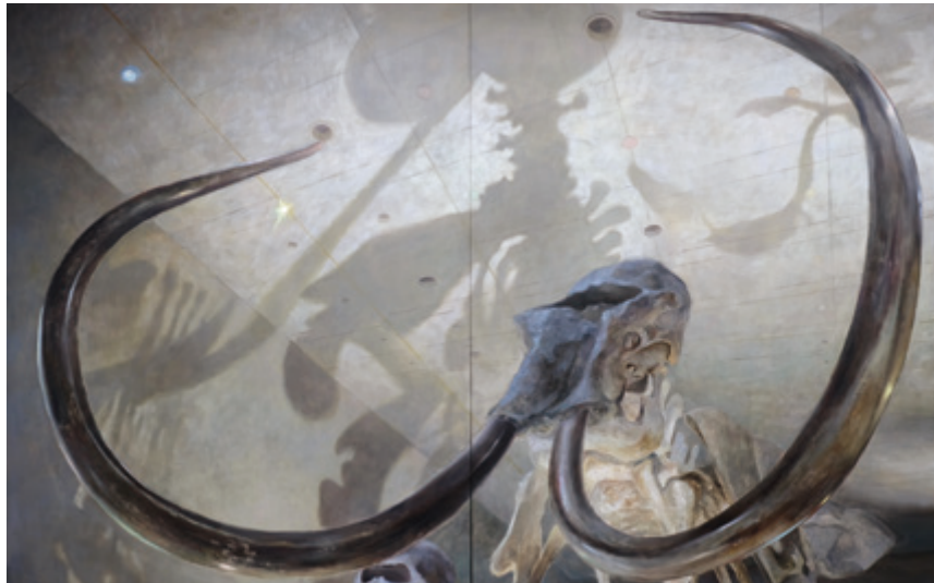
せり出す異様と掘り所 2022 油彩、キャンパス 259×388 cm