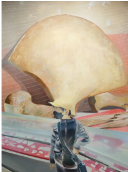
威勢す借 2022 油彩、キャンパス 259×194 cm