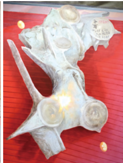
筆記体 2022 油彩、キャンパス 259×194 cm 全て作家蔵 © Shusuke Tanaka Courtesy of the artist