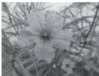
ヤナギバルイランソウ

2015年から2019年まで市民参加型の外来生物調査として大阪府を中心にさまざまな外来生物の分布調査を行いました。その成果である分布図を中心に、大阪府周辺の外来生物を紹介します。